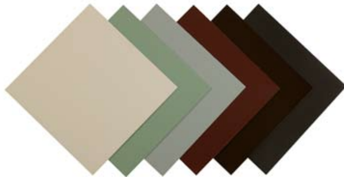
Elfenben - Kobbergrøn - Gråblå - Terrakotta - Mørkebrun - Skifergrå

Lakeret zink leveres med én farve på side 1 og en anden farve på side 2