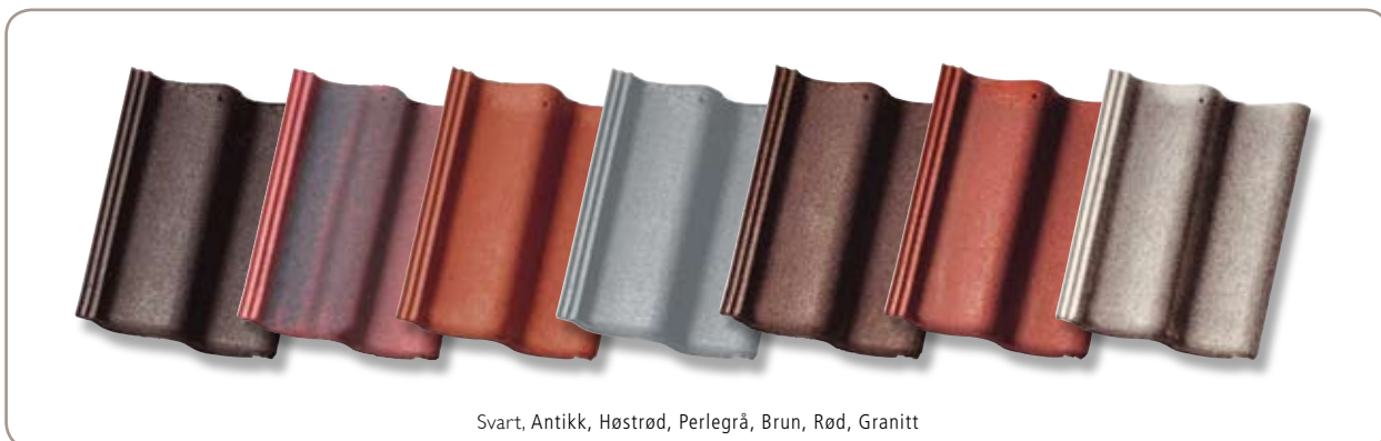
Svart, Antikk, Høstrød, Perlegrå, Brun, Rød, Granitt

** Der hvor det er fremkommelig med våre biler.